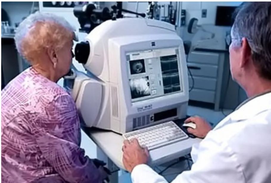
Esecuzione della tomografia ottica computerizzata (OCT)